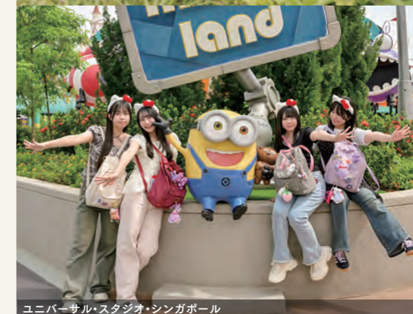
ユニバーサル・スタジオ・シンガポール