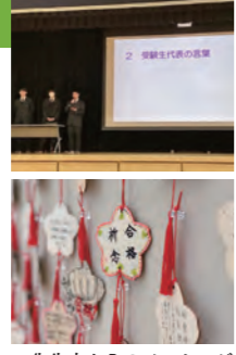
先生方からのメッセージ

令和8年1月8日(木)、大学受験を控えた3年生を励ますため、大学入試壮行会を実施しました。一般選抜を目前に控えた受験生が体育館に集まり、心を一にする温かい時間となりました。はじめに学校長から激励の言葉が贈られ、これまでの努力を称えとともに、本番に向けた心構えが語られました。続いて受験生代表が、仲間や教職員、家族への感謝と力強い決意を述べ、大きな拍手に包まれました。また、学校から記念品として鉛筆やキットカットが贈られ、会場は和やかな雰囲気になりました。受験生たちは多くの支えを実感し、本番に向けて気持ちを新たにされた様子でした。