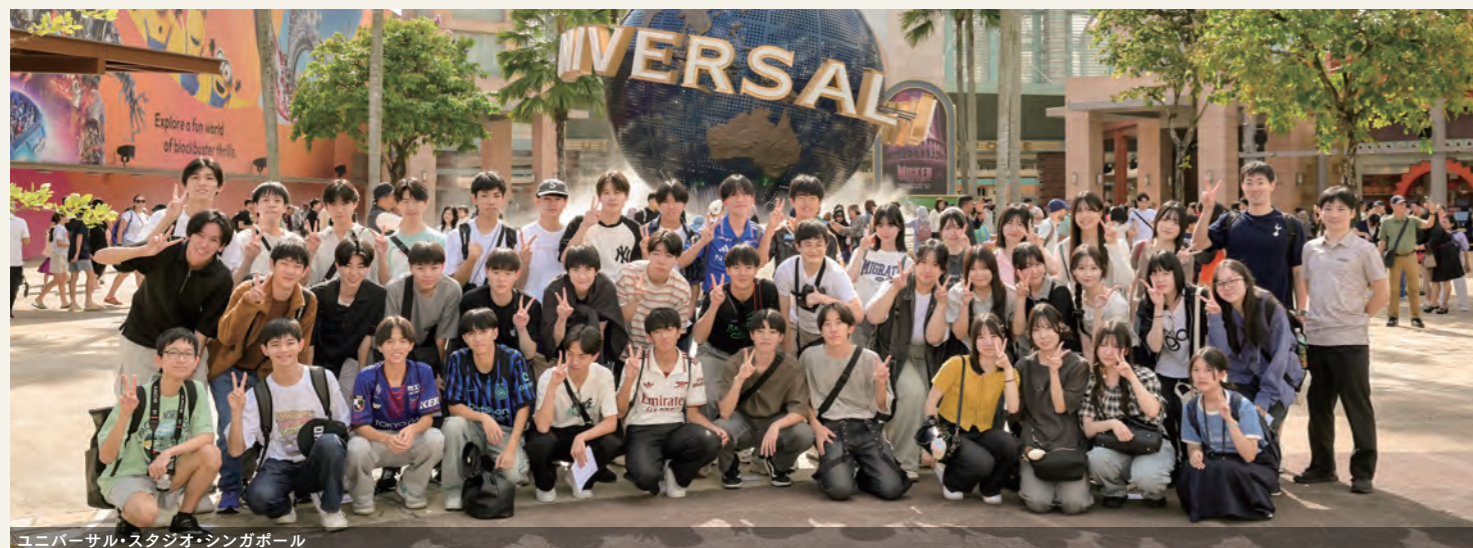
ユニバーサル・スタジオ・シンガポール