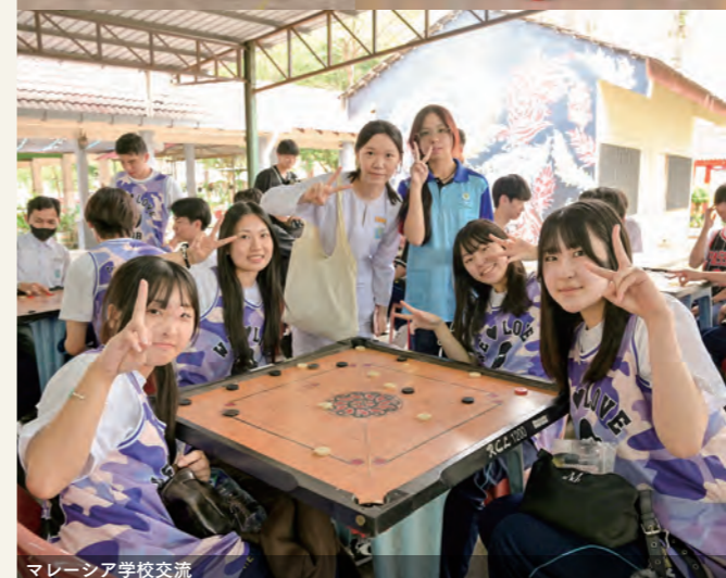
マレーシア学校交流