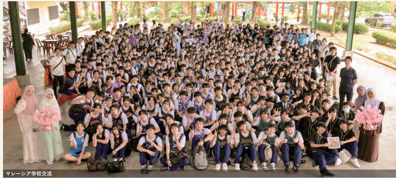
マレーシア学校交流