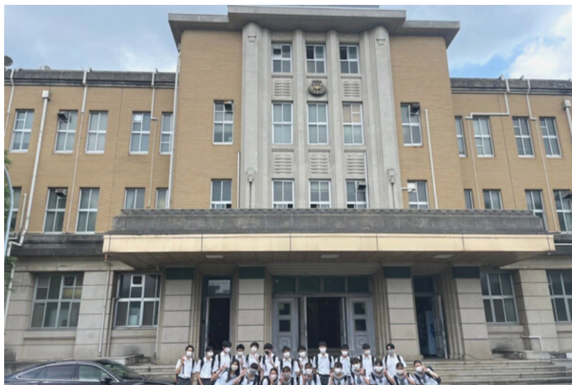
令和4年度 学部訪問（医学部キャンパス）の様子