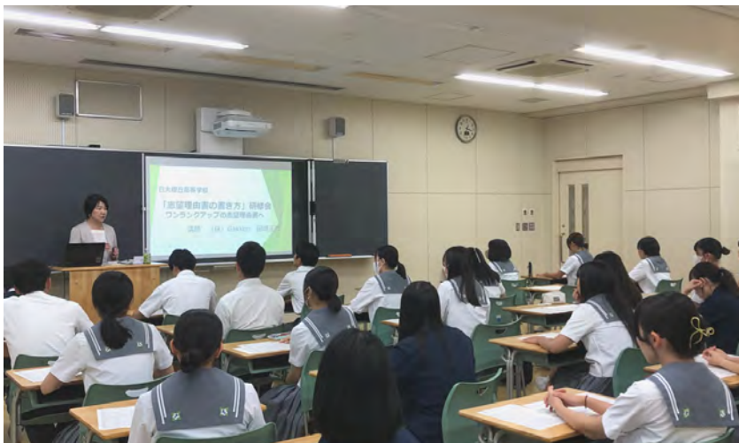
9/12実施 3年生(希望者)志望理由書書き方講座