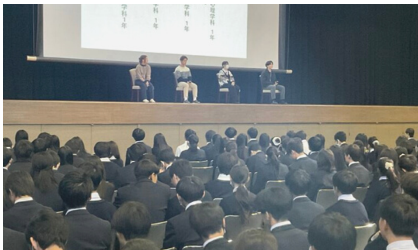
2年進路説明会 (11/18実施) 卒業生によるパネルディスカッション