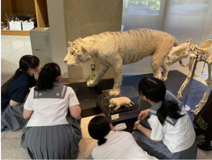
令和5年度 学部訪問（生物資源科学部キャンパス）の様子